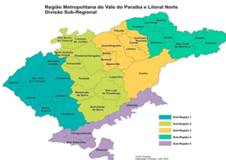
Figura 1. Divisão Sub-Regional da RMVale.